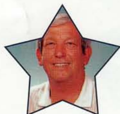
Dick Bogert Sound Production