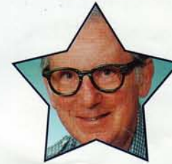
Zeke Zarchy Trumpetista